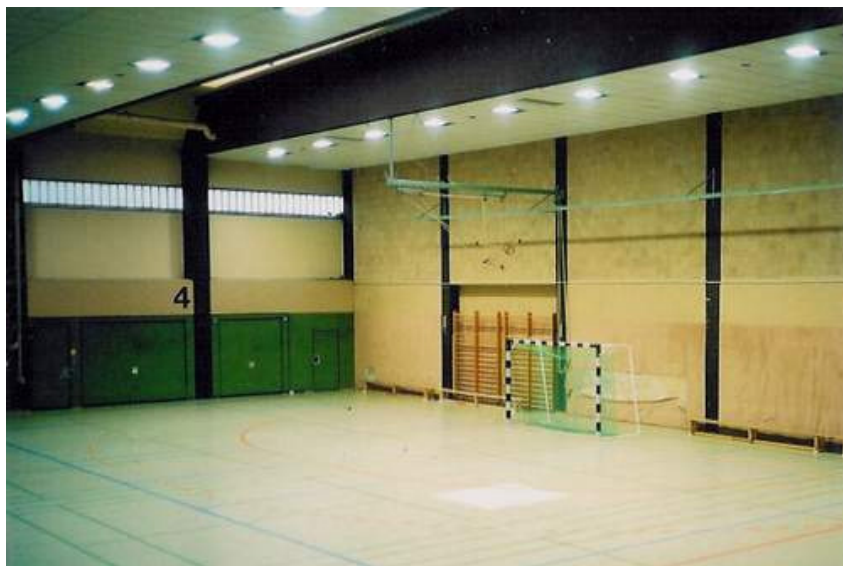
SPORTLEREINGANG + BLICK IN DIE HALLE VOR DER SANIERUNG